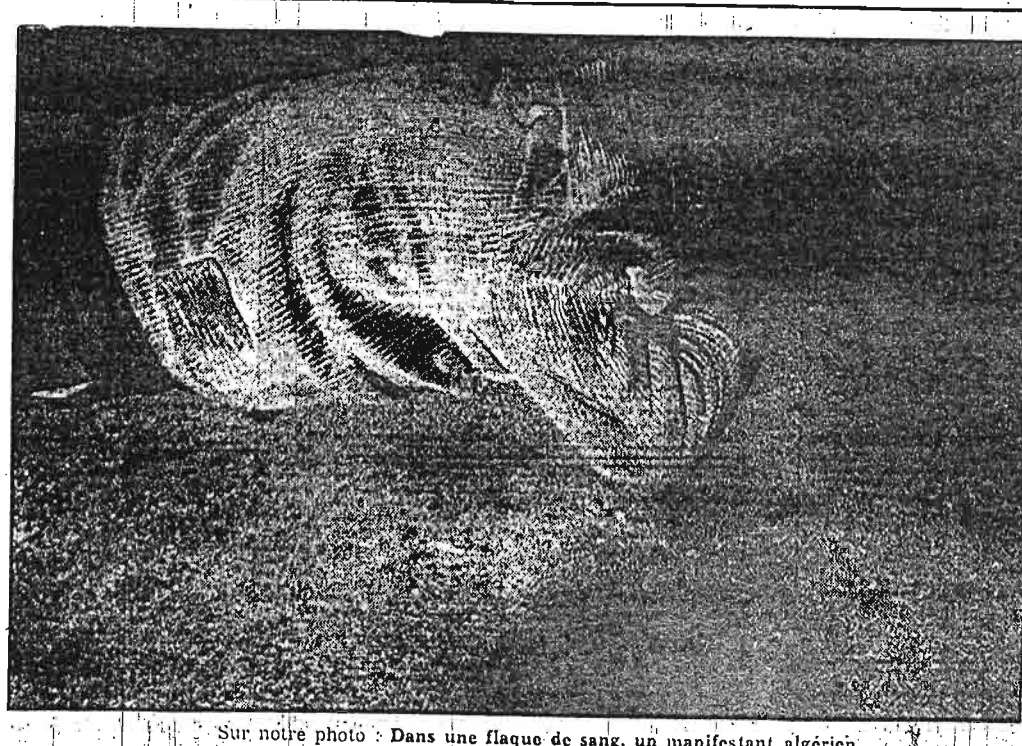
Sur notre photo: Dans une flaque de sang, un manifestant algérien.

Pas le début du commencement d'une ombre de preuve... Georges ROYER.