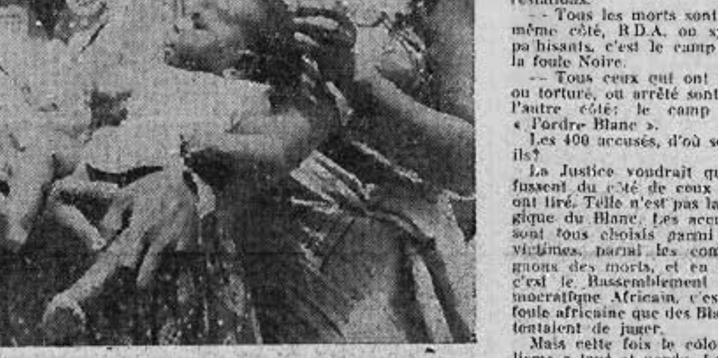
Son papa est en prison, pour avoir demandé l'application de la Constitution.

FRANÇOISE ROSAY « Je condamne toute forme de racisme et d'antisémitisme... » Et la trouve objecte et imbecille les procédés du comité antijuif du cinéma... Louis DAQUIN « Je m'élevais naturellement contre cet acte inqualifiable, qui aurait pu avoir des suites mortelles... »