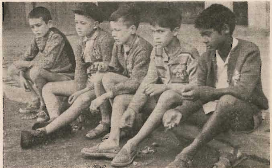
Gentils enfants de Drancy... Une belle image de « Pitchipoï »