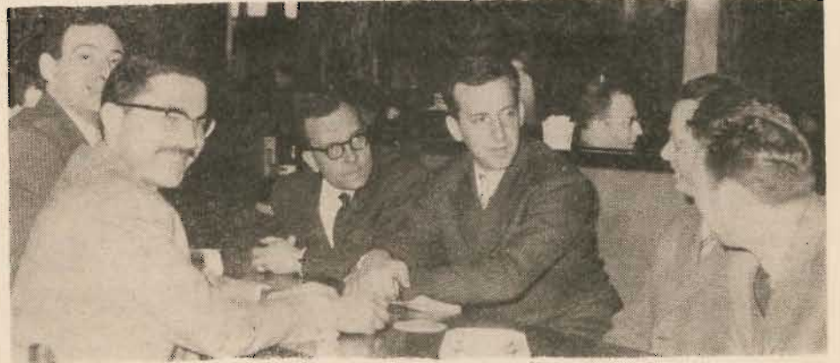
Premier contact à la gare du Midi...

D'une façon générale, nos deux délégués ont reçu de la part de nos amis belges, un accueil des plus cordiaux. Et, après deux jours d'entretiens, de rencontres, de prises de contact diverses, on peut affirmer que cet intéressant voyage aura des résultats très positifs pour la cause que nous défendons.