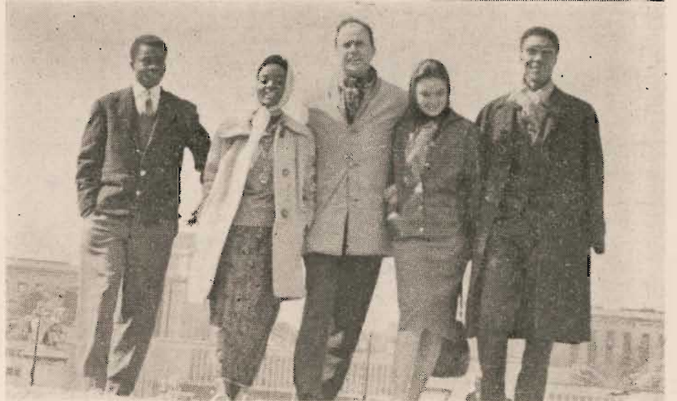
Jean Rouch et quatre interprètes de la « Pyramide Humaine » à Paris.