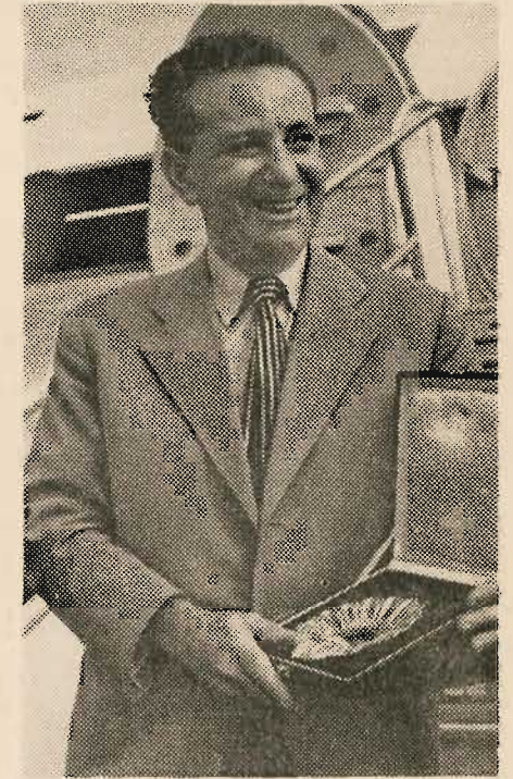
Lauréat de San Sebastian...

La Frontière volée . — Toile de fond, Munich en 1938. Sujet : une famille « mix-