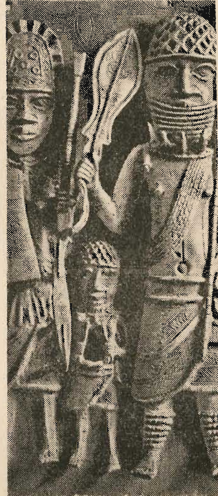
Sculptures africaines du 16 e siècle, témoignage de la civilisation du Bénin (Niger inférieur).

« Peut-être exceptionnellement, réfugiés en des solitudes désertes, pour « échapper à l'esclavage, dépourvus de « tout, errants en quête d'abri et de « nourriture, quelques nègres ont-ils pu « parfois, manger des cadavres. »