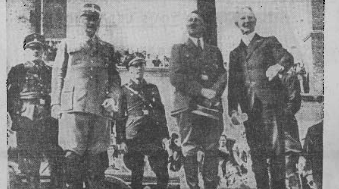
Dans l'Aurore, dont la lecture est officiellement recommandée par les dirigeants du R.F.P., Schacht, ministre des Finances de Hitler, banquier n°1, publie ses « Mémoires » sous le titre...