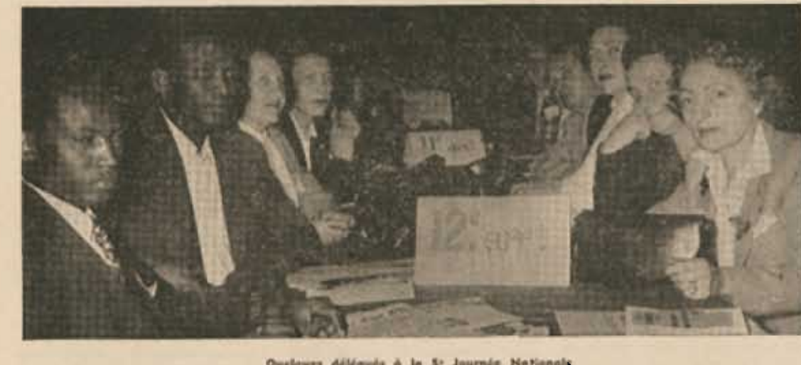
Quelques délégués à la 5 e Journée Nationale

Plusieurs maires de la région parisienne nous font part de leur accord complet avec l'initiative du M.R.A.P.