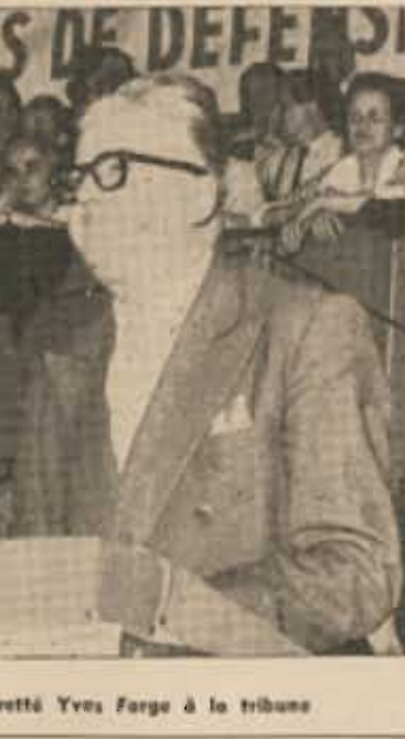
3 e Journée Nationale : le regretté Yves Farge à la tribune

De l'étranger commencent à arriver d'émouvants messages de solidarité.