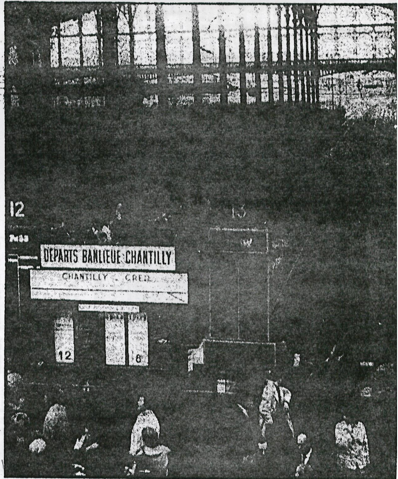
Gare du Nord : à l'heure de pointe des trains de banlieue, trois départs seulement étaient affichés hier en fin d'après-midi. (Photo « LE PARISIEN libéré ».)

GAZ-ÉLECTRICITÉ : baisses de pression et délestages possibles EAU : pénurie probable aux étages supérieurs POUBELLES : enlèvement incertain AIR FRANCE : retards et suppressions de vol à craindre (Voir p. 11)