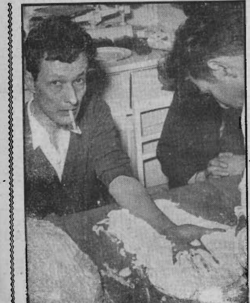
Ses mains se font mouler « pour l'éternité ».

— Devenez vite célèbre !... Je me ferai un plaisir de vous joindre à ma collection... CLAUDINE.