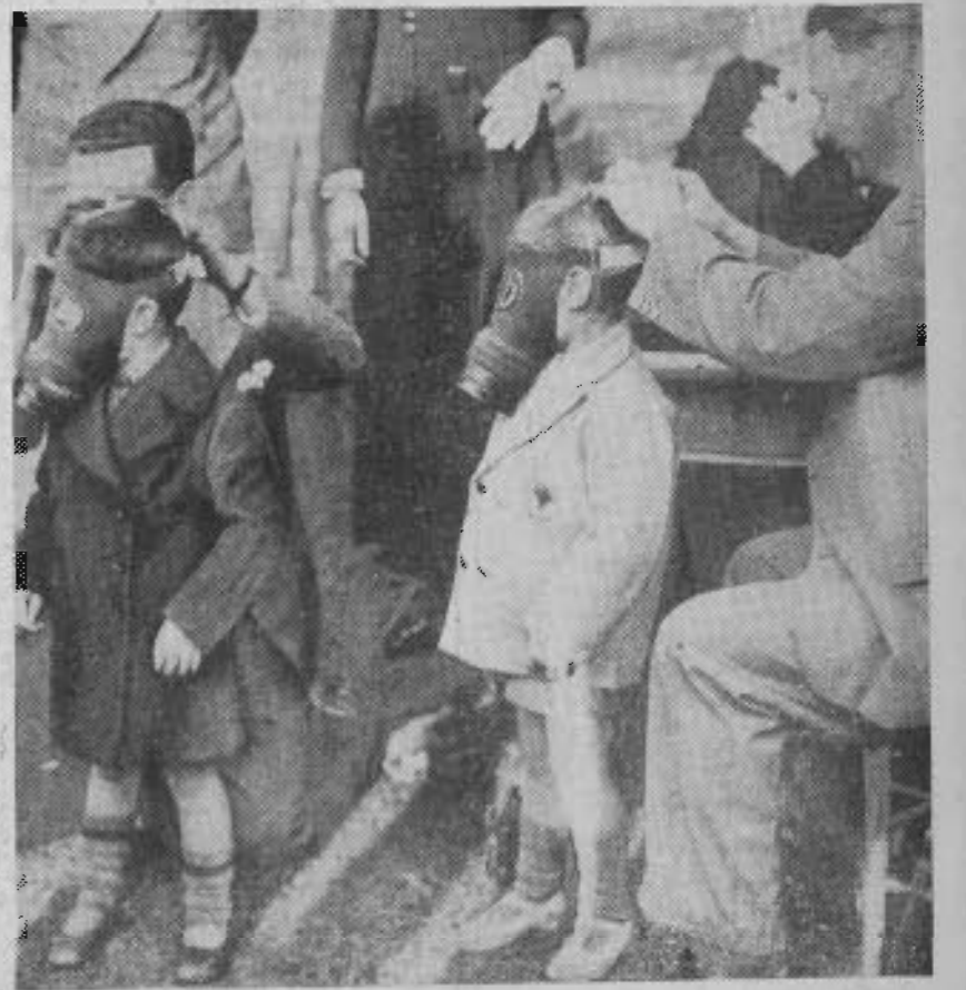
Ces visages ne sont pas faits pour porter de tels masques.