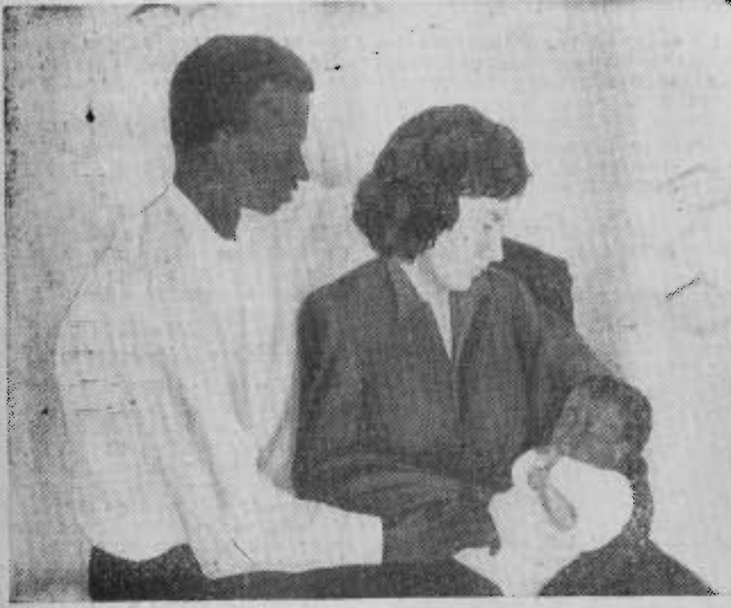
La Famille, tableau de Geneviève Zondervan.