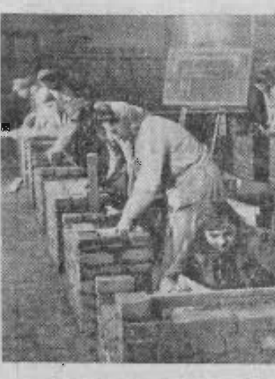
Une école de formation professionnelle pour la reconstruction en Allemagne démocratique