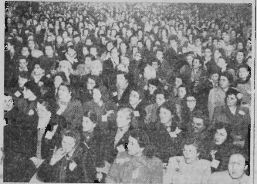
Une vue partielle de la foule réunie à Gennevilliers

Le 11 mars, à Gennevilliers, 40.000 femmes, déléguées de toute la France, ont fait le serment de lutter de toutes leurs forces contre la guerre. La Consultation nationale connaît chaque semaine un plus grand nombre de signatures (68.800 à ce jour pour le M.R.A.P.). Dans toute l'Europe, se prépare la Conférence européenne des travailleurs contre la remilitarisation de l'Allemagne, qui se tiendra les 23, 24 et 25 mars prochains à Berlin. Dans le même temps, M. Gromyko, à la Conférence des suprêmes, demande, contrairement aux Occidentaux, que l'Allemagne soit demilitarisée. (Voir nos informations en page 3.)