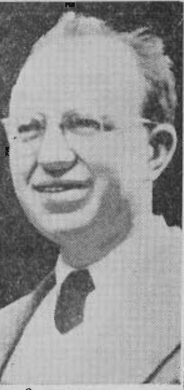
Portrait of Howard Fast.

Mais la répression qu'il connaît n'a pas empêché Howard Fast de nous faire valoir ses voix. Voici ce qu'il pense, lui, véritable démocrate, de l'affaire des Six de Trenton.