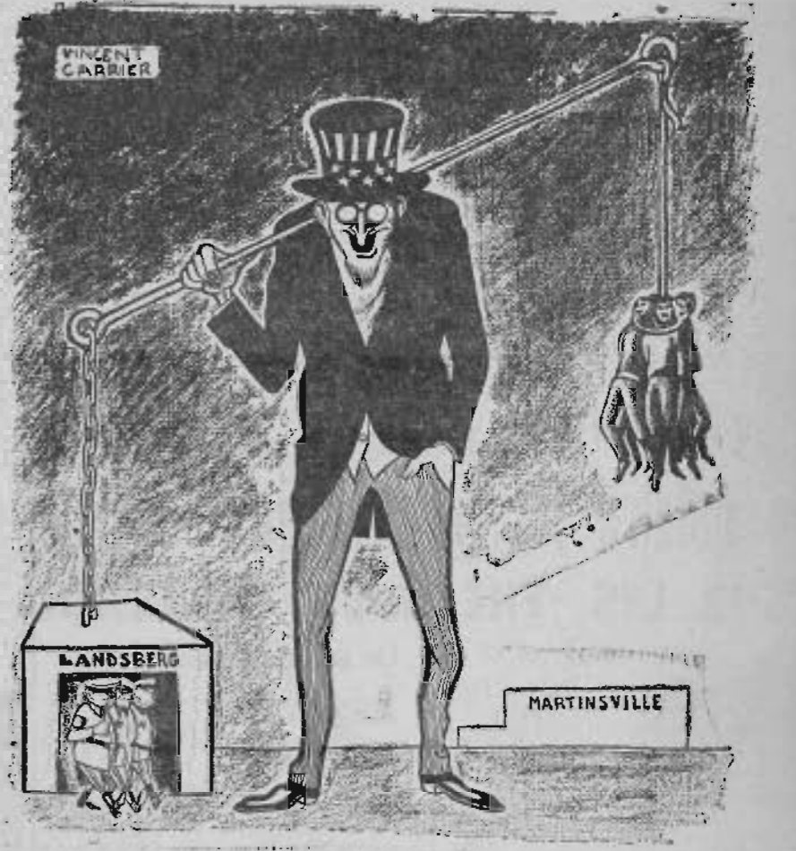
Justice est faite...