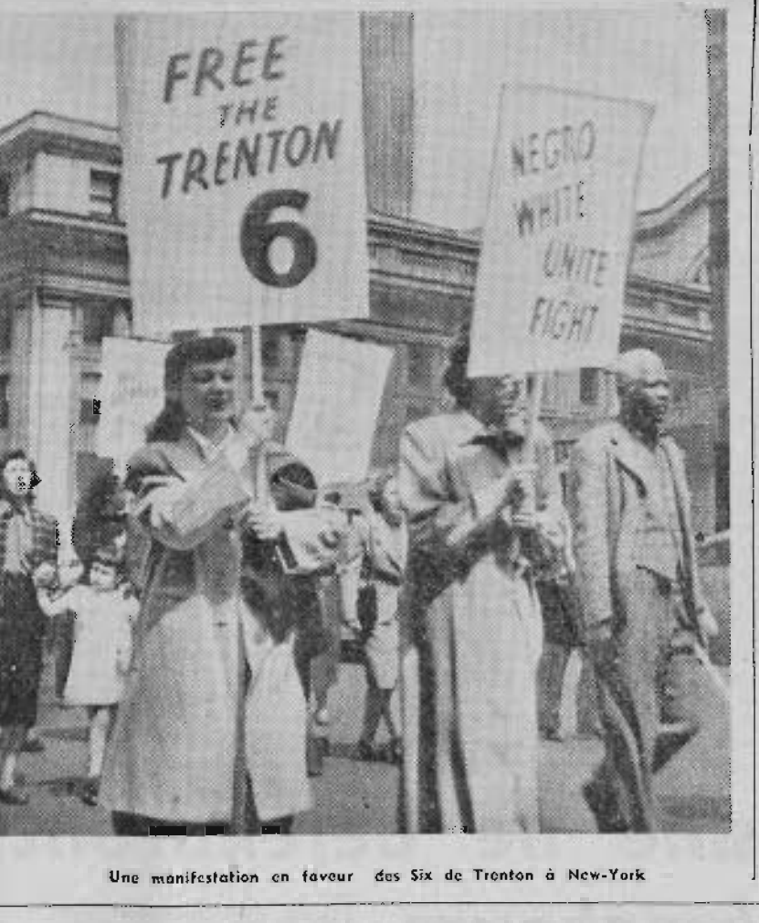
Une manifestation en faveur des Six de Trenton à New-York

Les prétextes invoqués ne pourront en aucun cas justifier de telles méthodes.