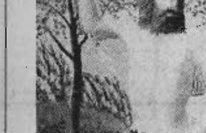
Adam et Eve au Paradis Fragment d'une toile de BAUCHANT

En 1825, la débâcle de la Seine à Paris détruisit deux ponts en bois.