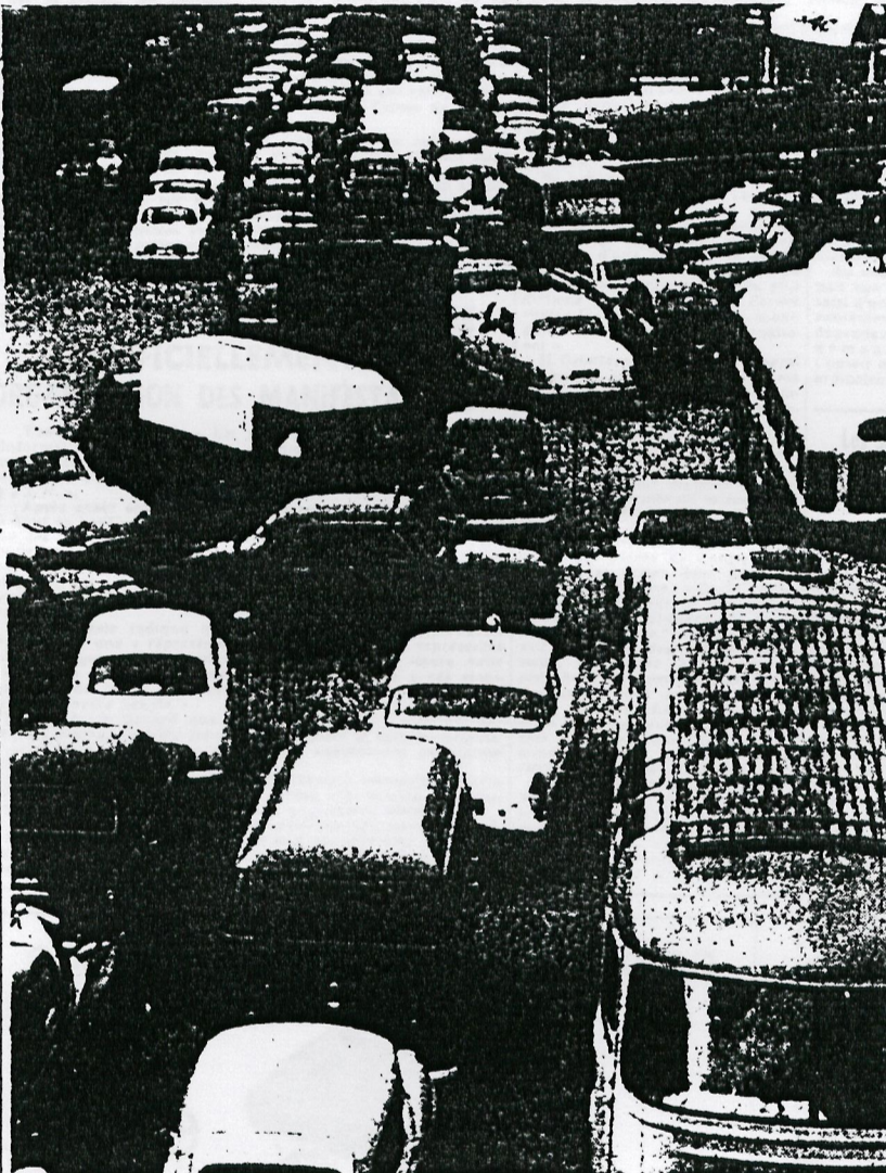
Avenue du Maine hier vers 11 heures du matin : de longues files de véhicules que traversent non sans peine camions et voitures venus des transports. Les feux ne fonctionnent pas... (PAGE 7 : LA SUITE DU REPORTAGE PHOTOGRAPHIQUE FIGARO.)

PAGE 21 : Les commentaires de notre envoyé spécial Roland MESMEUR