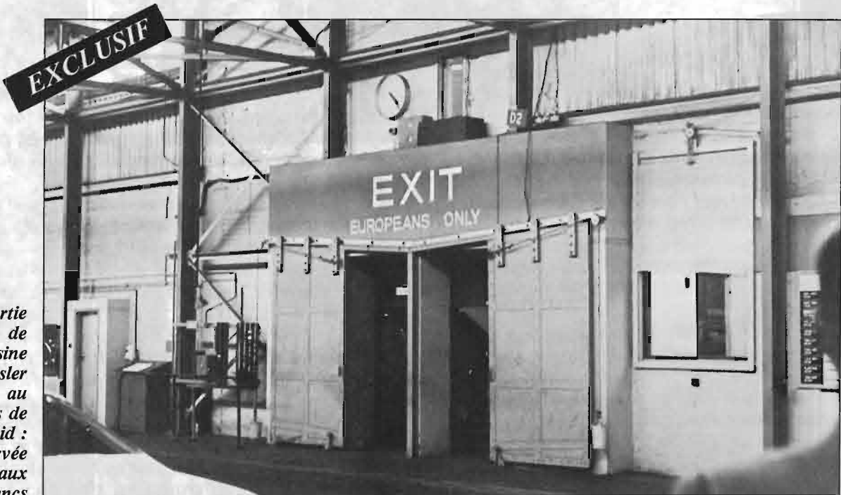
Une sortie de l'usine Chrysler au pays de l'apartheid : réservée aux Blancs

La France peut se passer des matières premières sud-africaines. Un document confidentiel révélé par Différences le prouve.